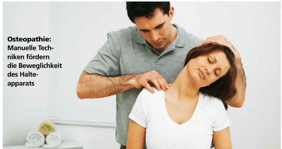
Osteopathie: Manuelle Techniken fördern die Beweglichkeit des Halteapparats