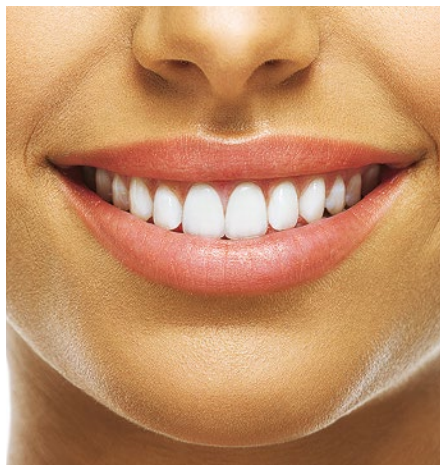
Strahlendes Lächeln: Eine professionelle Zahnreinigung hilft, Verunreinigungen aus den Zahnzwischenräumen zu entfernen und Neuablagerungen zu verhindern

Gefragt sind bei vielen Versicherten auch die Kostenübernahme oder Zuschüsse für professionelle Zahnreinigungen. Bedingungslos und komplett zahlt jedoch kaum